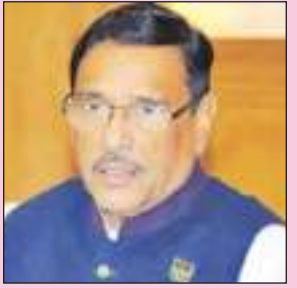
সরকারের বিরুদ্ধে দেশি-বিদেশি চক্র অপপ্রচার চালাচ্ছে

স্টাফ রিপোর্টার : আওয়ামী লীগের কারণে খুনের মাধ্যমে ক্ষমতা দখল বন্ধ হয়েছে জানিয়ে দলের সাধারণ সম্পাদক ওয়ায়দুল কাদের বলেছেন, স্থিতিশীল সরকার থাকায় ১৫ বছরে দেশের উন্নয়ন হয়েছে। গতকাল মঙ্গলবার রাজধানীর বঙ্গবন্ধু আভিমানিভিয়ে ঢাকা মহানগর উত্তর ও দক্ষিণ আওয়ামী লীগের যৌথ সভায় তিনি এ কথা বলেন। প্রধান অতিথির বক্তব্যে ওয়ায়দুল কাদের বলেন, একটি চিহ্নিত অপশক্তি দেশের গণতন্ত্র এবং জনগণের ভৌতিকার নস্যাৎ করতে নির্বাচনবিরাধী অপতন্ত্রতায় লিপ্ত রয়েছে। একাবদ্ধভাবে এই অপশক্তিকে প্রতিহত করতে হবে। তিনি বলেন, দেশবিরোধী অপশক্তি লাগাতারভাবে ষড়যন্ত্র করে যাচ্ছে। জনগণের ভৌতিকার বন্ধিত করতে নির্বাচনবিরাধী কাজ করছে তারা। তাদের বিরুদ্ধে একাবদ্ধ প্রতিরোধ গড়ে তুলতে হবে। ওয়ায়দুল কাদের বলেন, বঙ্গবন্ধু শেখ মুজিবুর