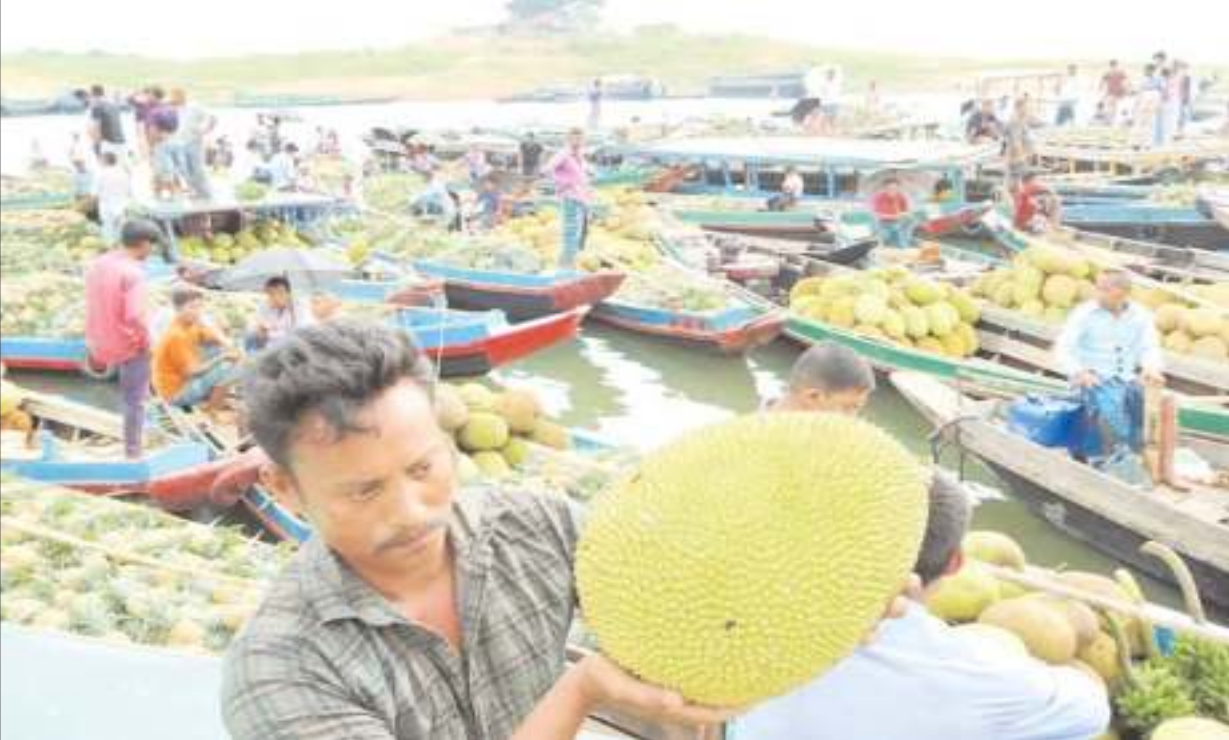
আনارس ও কাঠাল নিয়ে কেতোর অপেক্ষায় বিক্রেতারা। সমতা ঘাটে মৌসুমি ফলের ভাসমান হাট, বনরুপা, রাঙামাটি।