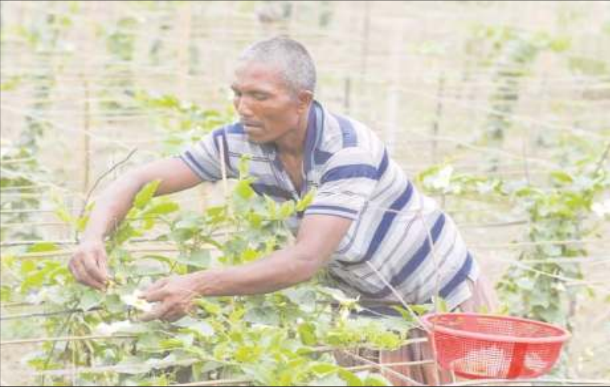
কাঁকরোল ফুলে কৃত্রিম পরাগায়ন ঘটচ্ছেন কৃষক। বাউপাড়া এলাকা, মিঠাপুকুর, রংপুর।