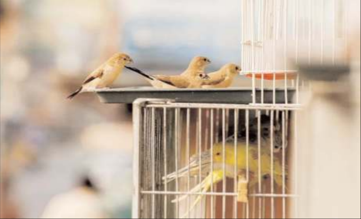
পোষা পাখি বিকিকিনির দোকানে পাখিবন্দী খাঁচার ওপর খাবার খেতে বসেছে মুক্ত পাখি। ফুল মার্কেট, খুলনা