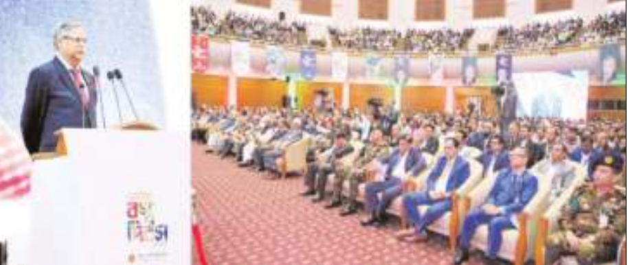
মঙ্গলবার রাত্রিপতি মো: সাহাবুদ্দিন ঢাকায় বঙ্গবন্ধু আন্তর্জাতিক সম্মেলন কেন্দ্রে জাতীয় বঙ্গ দিবস-২০২৩ এর উদ্বোধন অনুষ্ঠানে বক্তৃতা করে

স্টাফ রিপোর্টার : রমজান মাসে দ্রব্যমূল্য নিয়ন্ত্রণ এবং নিত্যপণ্যের সরবরাহ স্বাভাবিক রাখতে বারস্থা নেওয়ান প্রধানমন্ত্রীর ১৫ নির্দেশনা বাস্তবায়নে দেশের সব পৌরসভার মেয়র ও প্রশাসককে চিঠি পাঠিয়েছে স্থানীয় সরকার, পল্লী উন্নয়ন ও সমবায় মন্ত্রণালয়। সম্প্রতি স্থানীয় সরকার মন্ত্রণালয় থেকে এ চিঠি পাঠানো হয়েছে। চিঠিতে বলা হয়েছে, গত ১৫ জানুয়ারি অনুষ্ঠিত সরকারের বর্তমান মেয়াদের প্রথম মন্ত্রিসভা বৈঠকে সবার প্রতি প্রধানমন্ত্রী কতিপয় নির্দেশনা দিয়েছেন। প্রধানমন্ত্রীর দেওয়া নির্দেশনাগুলো বাস্তবায়নের জন্য প্রয়োজনীয় ব্যবস্থা গ্রহণসহ বাস্তবায়ন উদ্বোধন নিয়মিত পাঠানোর জন্য নির্দেশক্রমে অনুরোধ করা হলো। এতে উল্লেখ করা হয়, মন্ত্রিপরিষদ বিভাগ থেকে পাওয়া আধা-সরকারি পণ্যের পরিপ্রেক্ষিতে জানানো যাচ্ছে যে, গত ১৫ জানুয়ারি অনুষ্ঠিত সরকারের বর্তমান মেয়াদের প্রথম মন্ত্রিসভা-বৈঠকে প্রজাতন্ত্রের কর্মে নিয়োজিত সকলের প্রতি প্রধানমন্ত্রী নির্দেশনা দিয়েছেন।