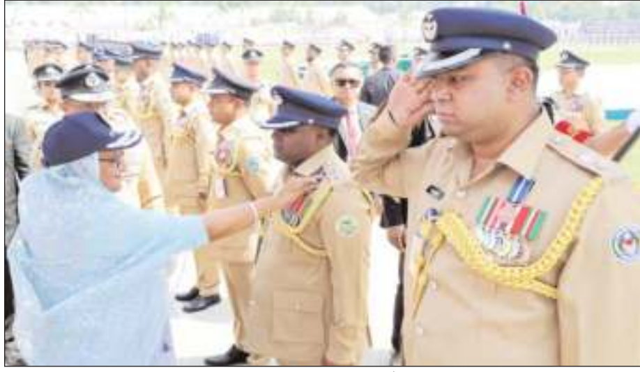
মঙ্গলবার রাজারবাগ পুলিশ লাইনে পুলিশ সঙ্গহ ২০২৪ উদ্বোধনী অনুষ্ঠানে সাহসীকতা ও বীরত্বপূর্ণ কাজের স্বীকৃতি স্বরূপ পিপিএম ও বিপিএম পদক পরিবেশন করেন প্রধানমন্ত্রী শেখ হাসিনা।

স্টাফ রিপোর্টার : প্রধানমন্ত্রী শেখ হাসিনা এজন্য সক্রিয় ভূমিকা পালনের আহ্বান জমিদার, সন্ত্রাস, মাদক ও দুর্নীতি দমনে পুলিশ জানিয়েছেন। তিনি বলেন, আমি পুলিশ বাহিনীর কাহিনীকে জনগণের সেবা অব্যাহত রাখার এবং