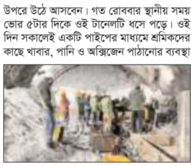
উপরে উঠে আসবেন। গত রোববার স্থানীয় সময় ভোর ৫টার দিকে ওই টানেলটি ধসে পড়ে। ওই দিন সকালেই একটি পাইপের মাধ্যমে শ্রমিকদের কাছে খাবার, পানি ও অক্সিজেন পাঠানোর ব্যবস্থা করা হয়। ভারতীয় গণমাধ্যমগুলোর খবর অনুযায়ী, শনিবার রাতের পালায় ওই টানেলে ৫০ থেকে ৬০ জন শ্রমিক কাজ করছিলেন। ধসের পর যারা টানেলের বেরিয়ে যাওয়ার মুখে কাজ করছিলেন তারা বেরিয়ে আসতে সক্ষম

আন্তর্জাতিক ডেস্ক : ভারতের উত্তরাখণ্ডে নির্মাণাধীন একটি হাইওয়ে টানেল ধসে চারদিন ধরে ভূগর্ভে আটকা পড়ে আছেন ৪০ জন শ্রমিক। তাদের উদ্ধারে নতুন এক ধরনের ড্রিল মেশিন আনা হয়েছে বলে জানিয়েছেন কর্মকর্তারা। তাদের বরাতে দিয়ে বিবিসি জানায়, রাজধানী দিল্লি থেকে গত বুধবার নতুন এই ড্রিল মেশিনটি আনা হয়। এর আগে আরো একটি মেশিন দিয়ে ধসে পড়া ধ্বংসাবশেষের ভেতর দিয়ে ড্রিল করে আটকে পড়া শ্রমিকদের বের করে আনতে একটি সুড়ঙ্গ তৈরির চেষ্টা করা হয়েছিল। কিন্তু বিশাল বিশাল বোম্বারের কারণে ওই মেশিনটি ড্রিল করতে ব্যর্থ হয়। শ্রমিকদের উদ্ধারের জন্য প্রথমে ধ্বংসাবশেষের ভেতর দিয়ে ড্রিল করে একটি সুড়ঙ্গ তৈরির পরিকল্পনা করা হয়েছে। তারপর ওই সুড়ঙ্গ দিয়ে একটি পাইপ টুকিয়ে দেওয়া হবে এবং শ্রমিকরা পাইপ বেয়ে