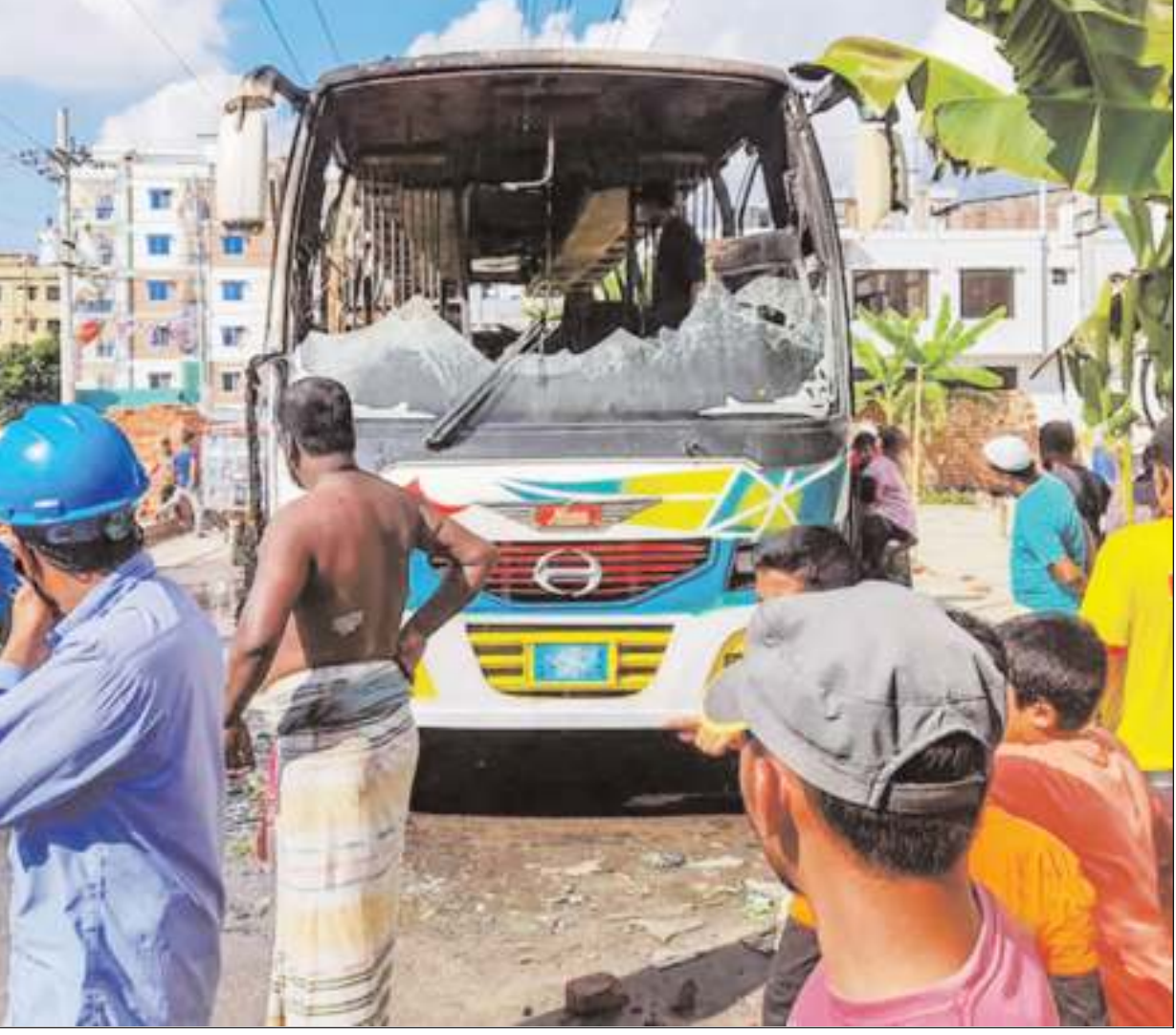
বিএনপির ডাকা ৪৮ ঘণ্টা হরতালের প্রথম দিন রোববার গাজীপুর নগরীতে সড়কে দাঁড় করিয়ে রাখা একটি বাসে আঙন দেয় দুর্ভাগারা।