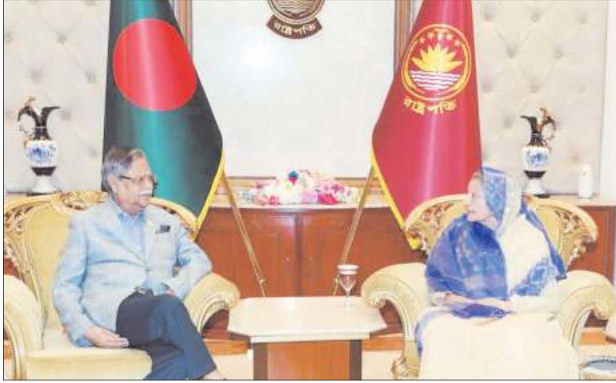
রাষ্ট্রপতি মোঃ সাহাবুদ্দিনের সাথে বঙ্গভবনে জাতীয় সংসদের বিরোধী দলীয় নেতা বেগম রওশন এরশাদ এর নেতৃত্বে প্রতিনিধিদল সাক্ষাৎ করেন।