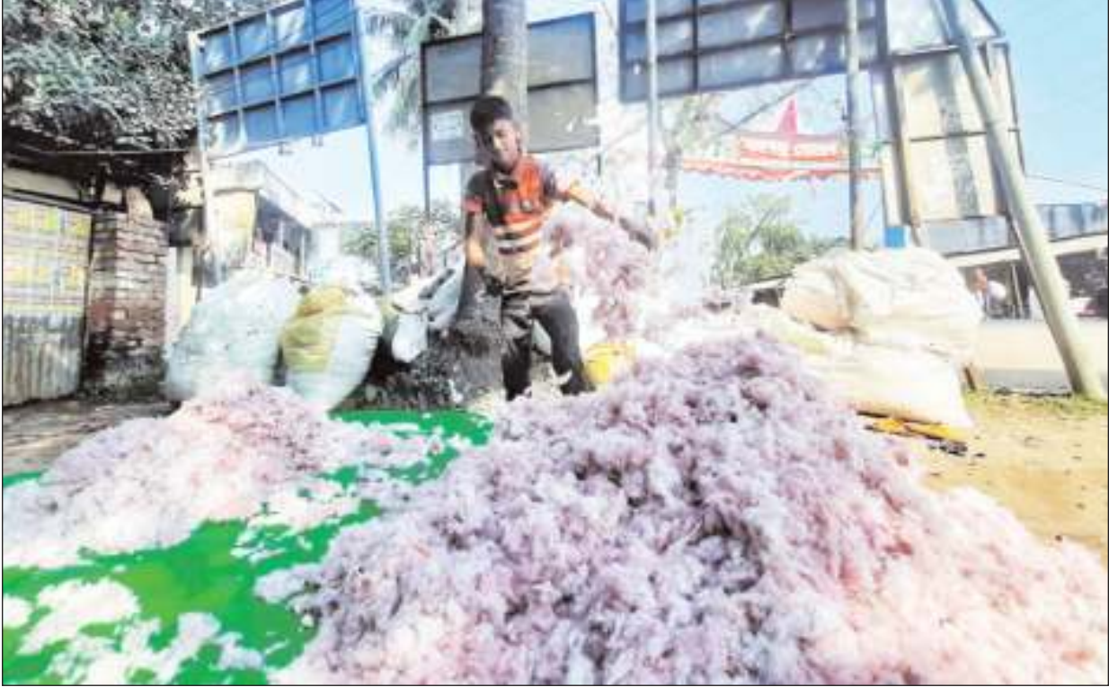
খুলনা : শীতের শুরুতে লেপ তৈরি করতে ব্যস্ত কারিগররা। গার্মেন্টসের জুট তুলি দিয়ে লেপ তৈরি করা হয় একদিনে পাচ থেকে ছয়টা লেপ তৈরি করা যায়। প্রতিটি লেপ আকার ভেদে ১২০০ থেকে ১৬০০ টাকা বিক্রি হয়। ছবিটি শিরোমনি এলাকা থেকে তোলা।

এ পুলিশ সত্রে জানা যায়, সকাল আনুমানিক ১০ দিকে খুলনা মেট্রো টি-১১-০৬৮৮ ট্রাকে পাটের কার্টিস ভর্তি একটি ট্রাক দেয়াড়ায় অবস্থিত মডল জুট মিলে যাত্রিল। ট্রাকটি ব্রুকপাতী সরদার বাড়ির সামনে পৌঁছালে সড়কের পাশে গফফার সরদারের দোকানের সার্ভিস তার রুটের ট্রাকে জড়িয়ে ছিড়ে যায় এবং তাত্ক্ষণিকভাবে আগুন লেগে যায়। আগুন লাগা ট্রাক সূত্রীর কুল বাজারে পৌঁছালে ট্রাকে ড্রাইভার জলদ্র ট্রাক খামিয়ে পালিয়ে যায়। এ অবস্থা দেখে বাজারের লোকজন আধা ঘণ্টা ধরে পাটের ট্রাকে আগুন নিয়ন্ত্রণে আনার চেষ্টা করে। খবর পেয়ে ফরমাইশখানা ফায়ার সার্ভিসের একটি ইউনিট দ্রুত