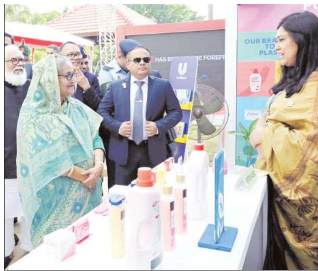
প্রধানমন্ত্রী শেখ হাসিনা চাকায় হোটেল র্যাডিসনে বৃত্তে 'ফরেন ইনভেস্টরস চেম্বার অব কমার্স অ্যান্ড ইন্ডাস্ট্রির ৬০ বছর পূর্তি উদযাপন এবং ইনভেস্টমেন্ট এক্সপো ২০২৩-এর উদ্বোধন শেষে বিভিন্ন স্টল পরিদর্শন করেন।