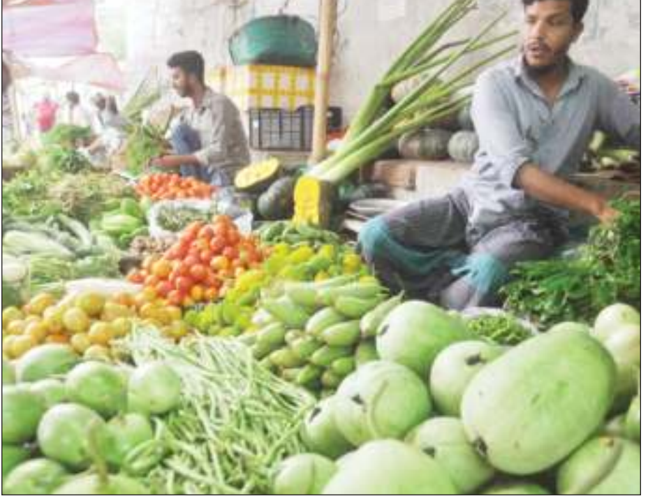
কাঁচা শাক-সবজী সহ দিন দিন বেড়েই চলেছে নিত্য প্রয়োজনীয় জিনিসের দাম। এতে হিমশিম খাচ্ছে সাধারণ নিম্ন আয়ের মানুষ। ছবিটি রোববার চট্টগ্রামের ঝাউতলা রেলওয়ে বাজার থেকে তোলা।

স্টাফ রিপোর্টার : বগুড়ায় তারুণ্যের রোডমার্চে যাওয়ার সময় নাটোরের বিভিন্ন স্থানে বিএনপি নেতাকর্মীদের ওপর হামলার অভিযোগ উঠেছে। গতকাল রোববার সকালে সরকার দলীয় নেতাকর্মীরা বেশ কয়েকটি গাড়ি ভাঙচুর করে একটি মাইক্রোবাসে অগ্নিসংযোগ করে বলে অভিযোগ বিএনপি নেতাকর্মীদের। বিএনপির একাধিক সূত্র জানায়, সকাল থেকে নাটোরের বিভিন্ন এলাকায় অবস্থান নেয় সরকার দলীয় কর্মকর্তারা। এ সময় নাটোর-বগুড়া সড়কের দিঘাপতিয়া এলাকায় যাত্রীবাহী বাসসহ বিভিন্ন যানবাহন ধামিয়ে তল্লাশি চালায় তারা। সেখানে একটি প্রাইভেটকার ভাঙচুরের অভিযোগ ওঠে। এ ছাড়া শহরের ৭-এর পাতায় দেখুন